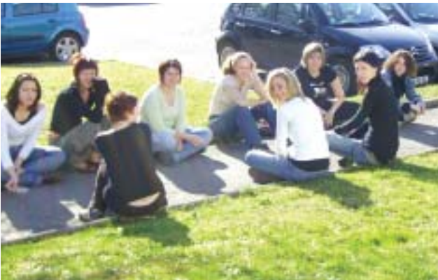
Les jeunes apportent un regard nouveau dans l'entreprise.

Ce type de contrat a l'avantage de proposer des réponses intéressantes pour différents besoins de l'entreprise.