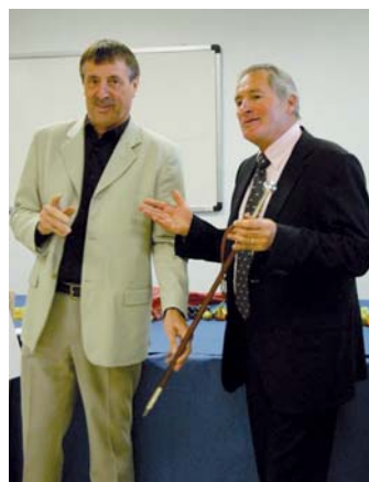
Remise d'un makila d'honneur

Il n'y a aucune raison objective pour que d'autres pages ne soient pas écrites, encore et toujours plus belles.